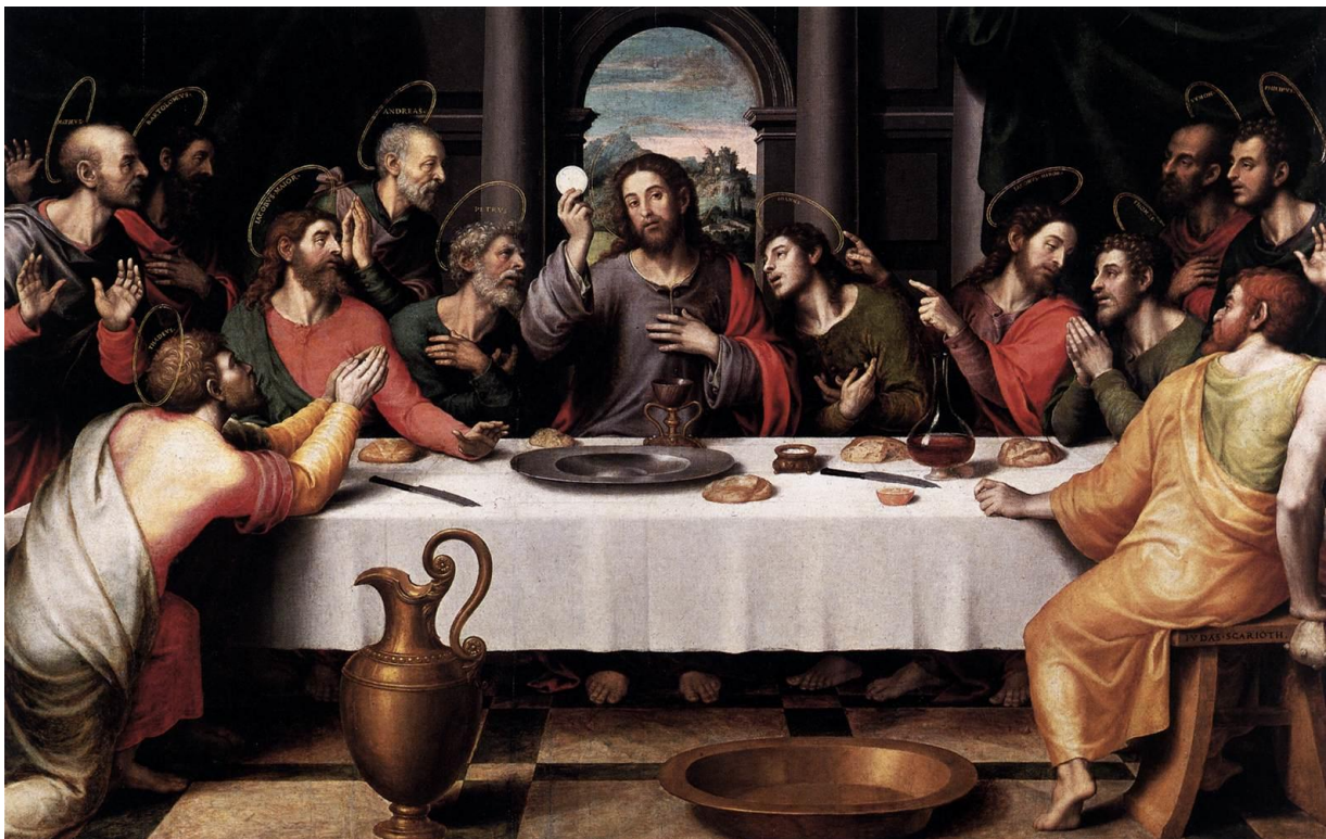
Jacopo Bassano (circa 1515-1592), Het laatste avondmaal .

Een van de leerlingen, Judas, had ondertussen het leger van het Sanhedrin (het joodse gerechtshof) opgehaald en bracht de soldaten naar de tuin van Getsemane. Hier verried hij Jezus door een kus. Jezus werd gearresteerd. Eerst moest hij voor hogepriester Annas verschijnen. Daarna werd hij naar het paleis van Kajafas gebracht. Hier werd een valse getuigenverklaring afgelegd. Jezus werd bespuwd en geslagen. Petrus, die het paleis binnen geglipt is, werd opgemerkt. Hij ontkwam door te zeggen dat hij Jezus niet kende.