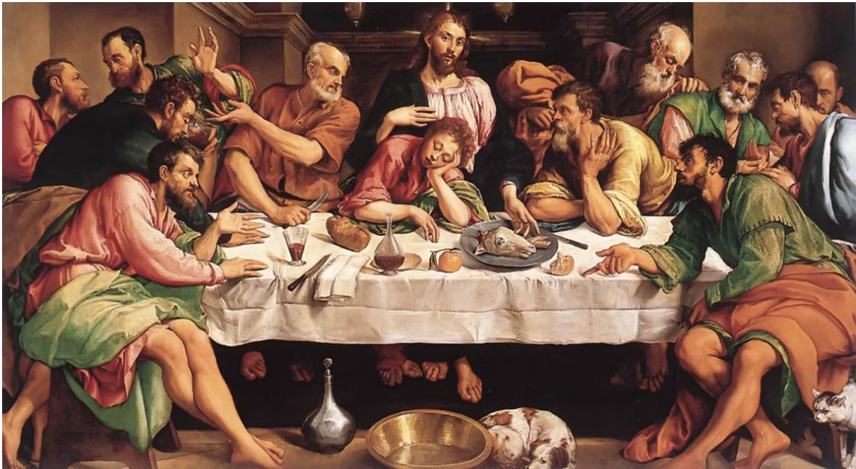
Jacopo Bassano (circa 1515-1592), Het laatste avondmaal , 1546, olieverf op linnen, Rome: Galleria Borghese.

deelnamen aan het avondmaal / de eucharistie. 3 De instelling vierde men immers in de avond van deze dag. Omdat men de instelling vierde, veranderde de kleur in wit (de kleur die wijst op feestvreugde). De naam Witte Donderdag herinnert wellicht aan de gewoonte kruisbeelden en andere beelden met een witte doek te bedekken. 4