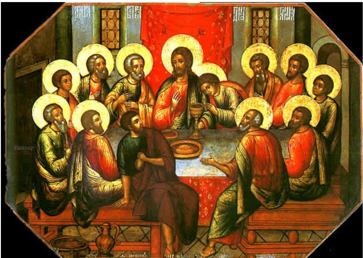
Simon Ushakov (1626-1686), Laatste avondmaal , 1685.