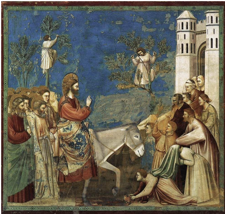
Giotto di Bondone (1266-1337), Intocht in Jeruzalem , 1304-06, fresco, 200 x 185 cm, Padua: Cappella Scrovegni (Arena kapel)

Wind en water doen denken aan de verhalen uit het Bijbelboek Genesis. Wind: de scheppende adem of de bode van de nadering van de Eeuwige. Water: een ons omringend, bedreigend element (we leven hachelijk op een eiland) of een levende stroom, de paradijsrivier. 'Het water is donker of helder, maar de wind ruist van verre vrede tussen de bomen. En de tijd is geen huis van bewaring, tenzij men dat zou verstaan als een behoedend lichaam, een vorm van leven, geen kerker maar een kerk, een perk, een tuin om in te zingen, te bidden en te beminnen ... Wij leven "binnen de tijd". Ons is de aarde een eiland van verlangen vanwege wind en water, omdat die ons vertellen van de voleinding, als de tijd niet zal zijn opgeheven, maar tot rust gekomen, in een eeuwige sabbath. Intussen, binnen de tijd, beleven wij de dagen onzer jaren en tellen van Pasen tot Pasen, niet in de tredmolen, maar in de wenteltrap', aldus dichter Willem Barnard (1920-2010). 1