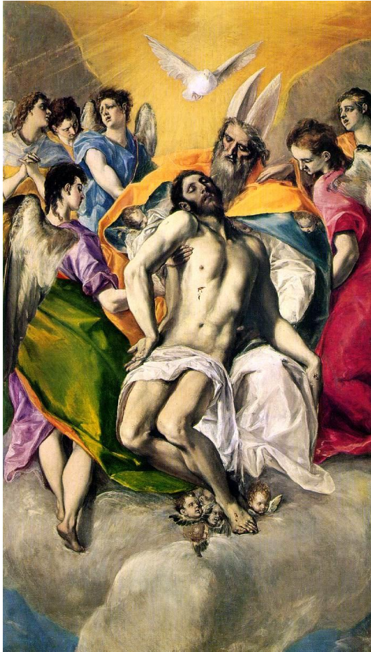
Domenikos Theotocopoulos (El Greco) (1541-1614), De heilige Drieëenheid (God: de Vader, de Zoon en de Heilige Geest), 1577-1579, Madrid: Museo del Prado.

met forse schreden een berg bestijgen, terwijl hoog uit de wolken de Vader de hand naar hem uitstrekt.