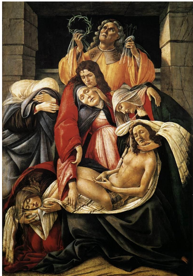
Sandro Botticelli (circa 1445-1510), Lamentatio , 1495, Milaan: Museo Poldi Pozzoldi.

De veertigste paasdag staat bekend onder de naam Hemelvaartsdag. 5 De naam is afgeleid van het laatste verschijningsverhaal van Lucas (24:50-51). Op de oudste afbeeldingen van hemelvaart (vierde eeuw) zien we Christus, het kruis op de schouders,