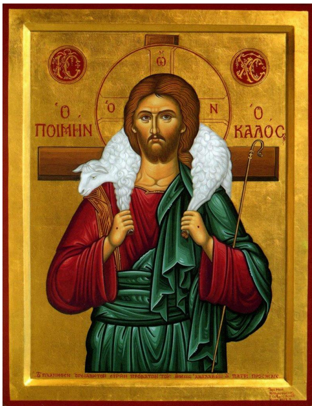
Icoon van de Goede Herder (Johannes 10).

De vijfde zondag van Pasen, Cantate (= zingt), is genoemd naar Psalm 98:1: 'Zingt voor de Heer een nieuw lied'. Op deze zondag wordt begonnen met lezingen uit de afscheidsrede van Jezus (Johannes 13:31-14:31).