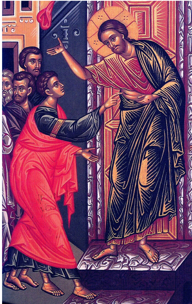
Icoon van het feest van Antipascha : Thomas raakt de wond van Jezus aan.

© Leen den Besten Zevenaar 8 april 2011.