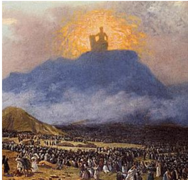
Jean Léon Gérôme (1824-1924), Mozes op de berg Sinai.

Bij de vormgeving van de veertig dagen voor Pasen speelden diverse teksten uit de Bijbel een rol waarin aan de periode van veertig dagen (of veertig jaar) een bijzondere betekenis wordt gegeven: veertig dagen en nachten duurde de zondvloed (Genesis 7:4 vv.), bleef Mozes op de berg Sinai voor hij de 'tien woorden' (tien geboden) ontving die de weg naar het leven wijzen (Exodus 24:18; 34:28) en was de profeet Elia onderweg naar de berg Horeb om daar God te ontmoeten (1 Koningen 19:18); Ezechiël moest veertig dagen op zijn rechterzijde gaan liggen om de ballingschap van Juda aan te kondigen (Ezechiël 4:6); veertig jaar zwierf het volk Israël door de woestijn (Jozua 5:6, vergelijk Handelingen 13:18; Hebreë 3:10, 17); na veertig dagen zou Ninevé ondergaan (Jona 3:4); veertig dagen en nachten verbleef Jezus in de woestijn voor hij in het openbaar begon op te treden (Marcus 1:13; Lucas 4:1-2). Het waren allemaal tijden van overgang, voorbereiding, boete, loutering.