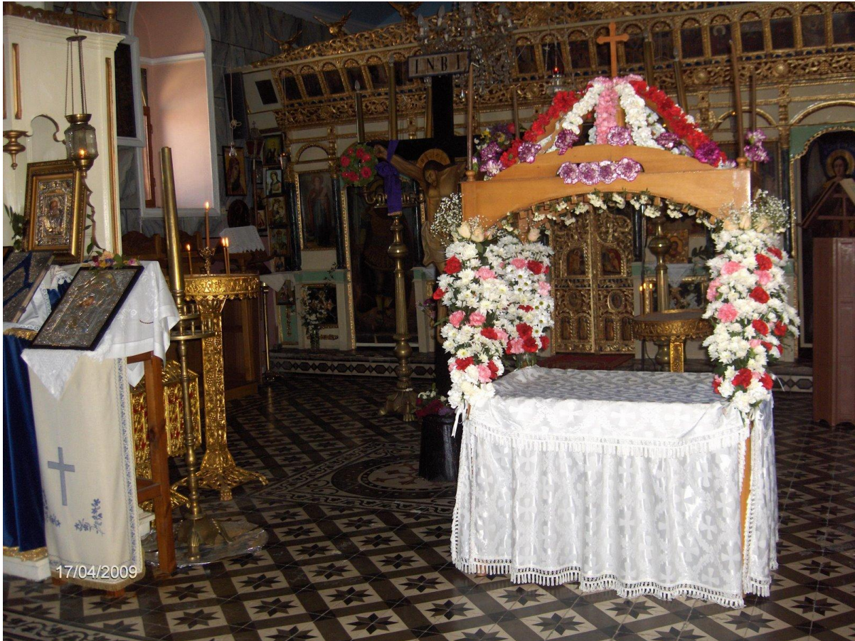
Interieur van een oosters-orthodoxe kerk.

Als het licht begint te worden, lopen de gemeenteleden met brandende kaarsen om de donkere kerk heen. Alle zwarte bekledingen en gewaden worden vervangen door witte. Het epitaphion (het doek waarop de gestorven Jezus is geborduurd) wordt in een plechtige processie naar de altaarruimte gebracht en op het altaar gelegd. De diaken bewierookt de gehele kerk. De liturgische sfeer verandert van verdriet in blijdschap. Het paasverhaal (vaak Marcus 16:1-8) wordt voorgelezen. Nu klopt de priester driemaal met het kruis tegen de gesloten kerkdeur. Deze gaat open en allen trekken met hun brandende kaarsen de kerk in. De gewijde klanken van de nacht, de stilte en spanning worden nu doorbroken. Er wordt een passend paaslied ingezet: 'Christus is opgestaan uit de doden. Hij heeft de dood door de dood overwonnen en aan de doden in de graven het leven geschonken.' De gelovigen geven elkaar een hand en zeggen daarbij: 'De Heer is waarlijk opgestaan'. Soms ook geven ze elkaar de vredeskus. Ieder heeft iets uitbundigs. Kinderen komen binnen. De vespers (morgengebeden) sluiten de viering af. Daarna gebruiken de gelovigen met elkaar in een feestelijke versierde zaal het paasontbijt.