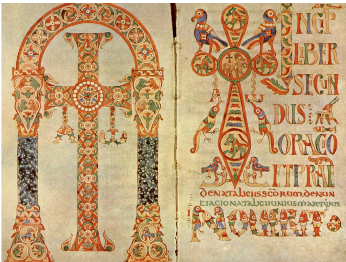
Sacramentarium Gelasianum Vetus , Titelblad en beginwoorden, achtste eeuw, perkament, 33,4 x 26 cm, Vaticaan: Biblioteca Apostolica

Een hoogtepunt in de paasnacht was het dopen van doopkandidaten (catechumenen): na soms jaren van voorbereiding werden ze nu in de doopkerk ondergedompeld in of begoten met water. 2 Nadat daarna hun voorhoofd was gezalfd, mochten ze zich kleden in witte mantels. De wachtende gemeente verwelkomde hen met een vredeskus en met de viering van het avondmaal / de eucharistie.