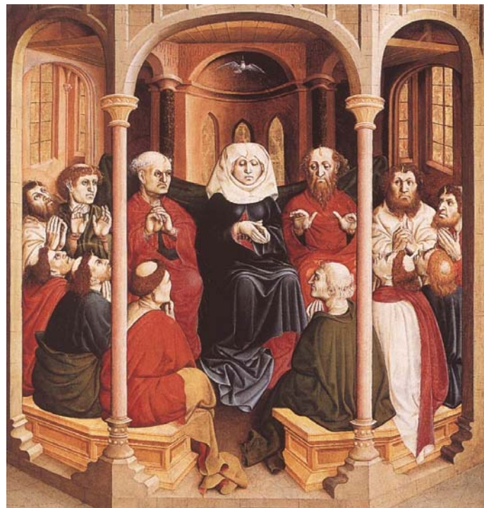
Hans Multscher (ca. 1400-1467), Pinksterfeest, 1437, paneel, 148 x 140 cm, Staatliche Museen, Berlin.

uitbundigheid van het middeleeuwse volksfeest aan