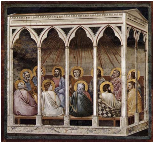
Giotto di Bondone (1267-1337), Pinksterfeest, 1304-1306, fresco, 200 x 185 cm, Cappella Scrovegni (Arena Chapel), Padua.

voor het Wekenfeest, dromden samen en waren stom verbaasd over wat ze hoorden en zagen. Sommigen van hen dachten dat de leerlingen van Jezus dronken waren. Petrus stond daarop op en aan de hand van allerlei citaten uit het Eerste Testament (de joodse