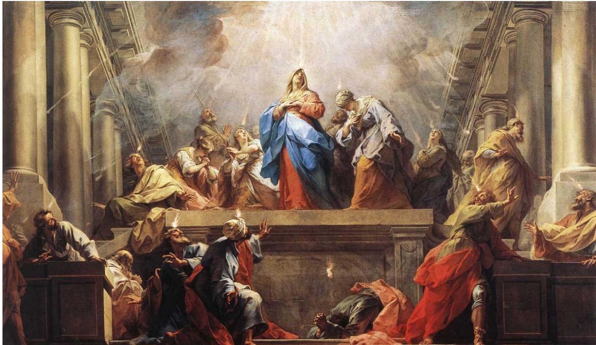
Jean II Restout (1692-1768), Het Pinksterfeest, olieverf op linnen, 465 x 778 cm, 1732, Musée du Louvre, Parijs.

is. Het is het feest dat hen oproept tot scheppen, dat wil zeggen: de aarde bewoonbaar maken en houden, chaos veranderen in een heilzame orde, puinruimen, ingekankerde ziektes (wanhoop, doemdenken, niet-nadenken) genezen, een menswaardig leven mogelijk maken, in de wereld een keten van bewoonbare plaatsen creëren, een spoor (een traditie) van oases in de woestijn.