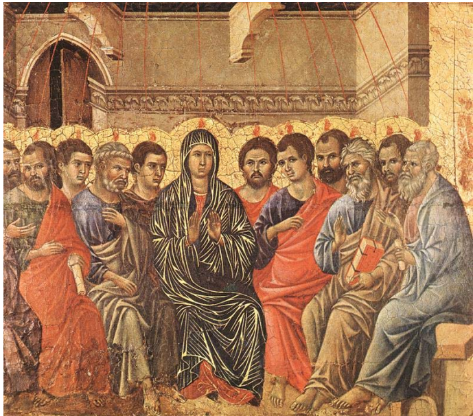
Duccio di Buoninsegna (ca. 1255-1319), Pinksterfeest, 1308-11, Tempera op hout, 37,5 x 42,5 cm, Museo dell'Opera del Duomo, Siena.

De inhoud van het Pinksterfeest is niet gemakkelijk te beschrijven en door te geven. Misschien is het Pinksterfeest daarom nooit erg populair geworden. Toch zijn vroegere generaties er niet voor teruggedeinsd om 'de uitstorting van de Heilige Geest' bijvoorbeeld in de kerk uit te beelden door het neerlaten van een duif.