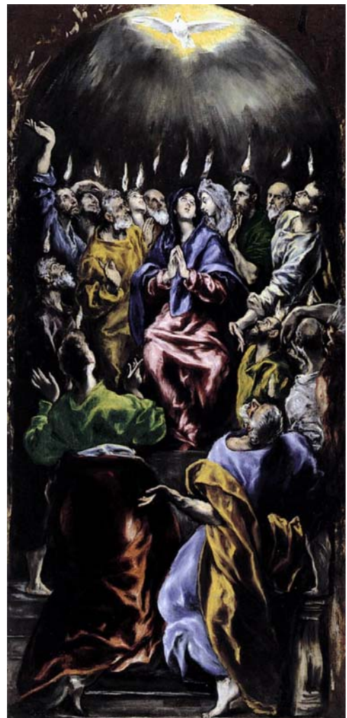
El Greco (1541-1614), Pinksterfeest, 1596-1600, olieverf op linnen, 275 x 127 cm, Museo del Prado, Madrid.