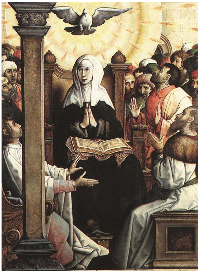
Juan de Flandes (ca. 1465-1519), Pinksterfeest, paneel, 110 x 84 cm, Museo del Prado, Madrid.

Oorspronkelijk was het feest van pinksterbruid - een uitbundig volksfeest, dat soms wel acht dagen duurde - een ode aan het voorjaar. Het mooiste meisje van het dorp werd door huwbare jongemannen tot pinksterbloem of -bruid gekozen en met bloemen versierd en gekroond. De jongemannen dansten om haar heen. De bloem of bruid symboliseerde het begin van een nieuwe zomer, maar ook de seksualiteit en de vruchtbaarheid. Het feest is overigens vrijwel overal verdwenen (zie: Volksgebruiken rond Pinksteren).