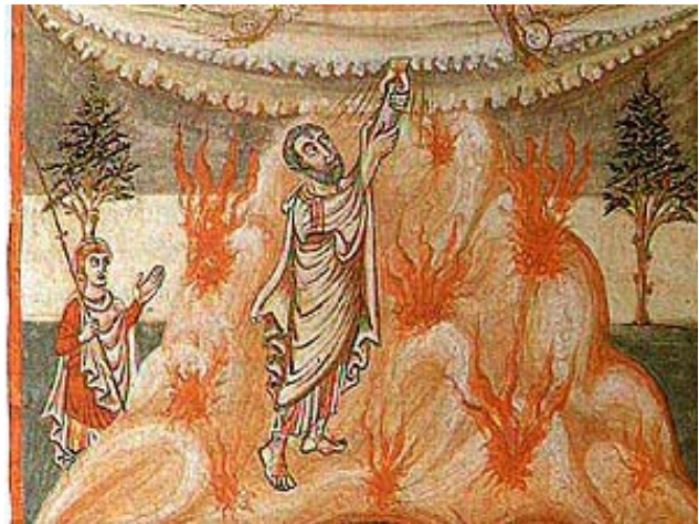
Mozes ontvangt de Thora.

Het joodse Wekenfeest, dat ten grondslag ligt aan het christelijke Pinksterfeest, was oorspronkelijk een oogstfeest. Omstreeks het begin van onze jaartelling veranderde het van karakter. Meer en meer herinnerden de gelovigen er elkaar op dit feest eraan wat de geloofstraditie vertelde: God sloot bij de berg Sinai een verbond met zijn volk en gaf het via Mozes de Thora in de vorm van de 'Tien Woorden' (de 'tien geboden' die richtinggevend werden voor het joodse leven, zie Exodus 19 en 20).