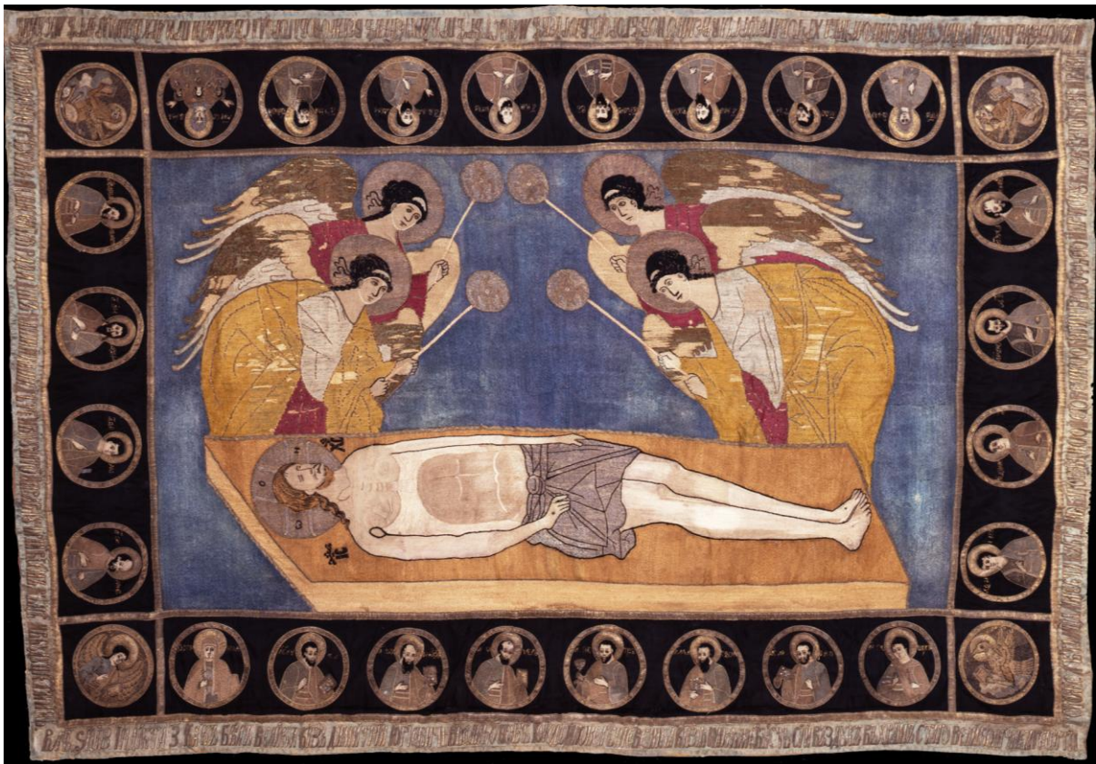
Epitaphios gemaakt in opdracht van Dmitry Shemyaka voor het Yurievklooster van Novgorod , 1444 of 1449: The Novgorod State United Museum Reserve.