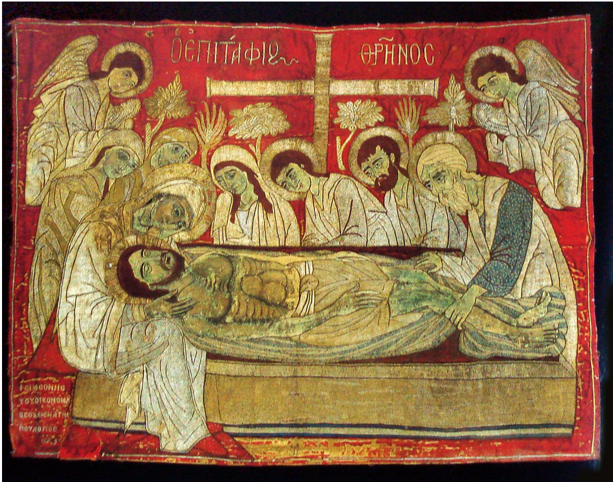
Theodosia Poulpos, Epitaphios , 1599, Athene: Benaki Museum.