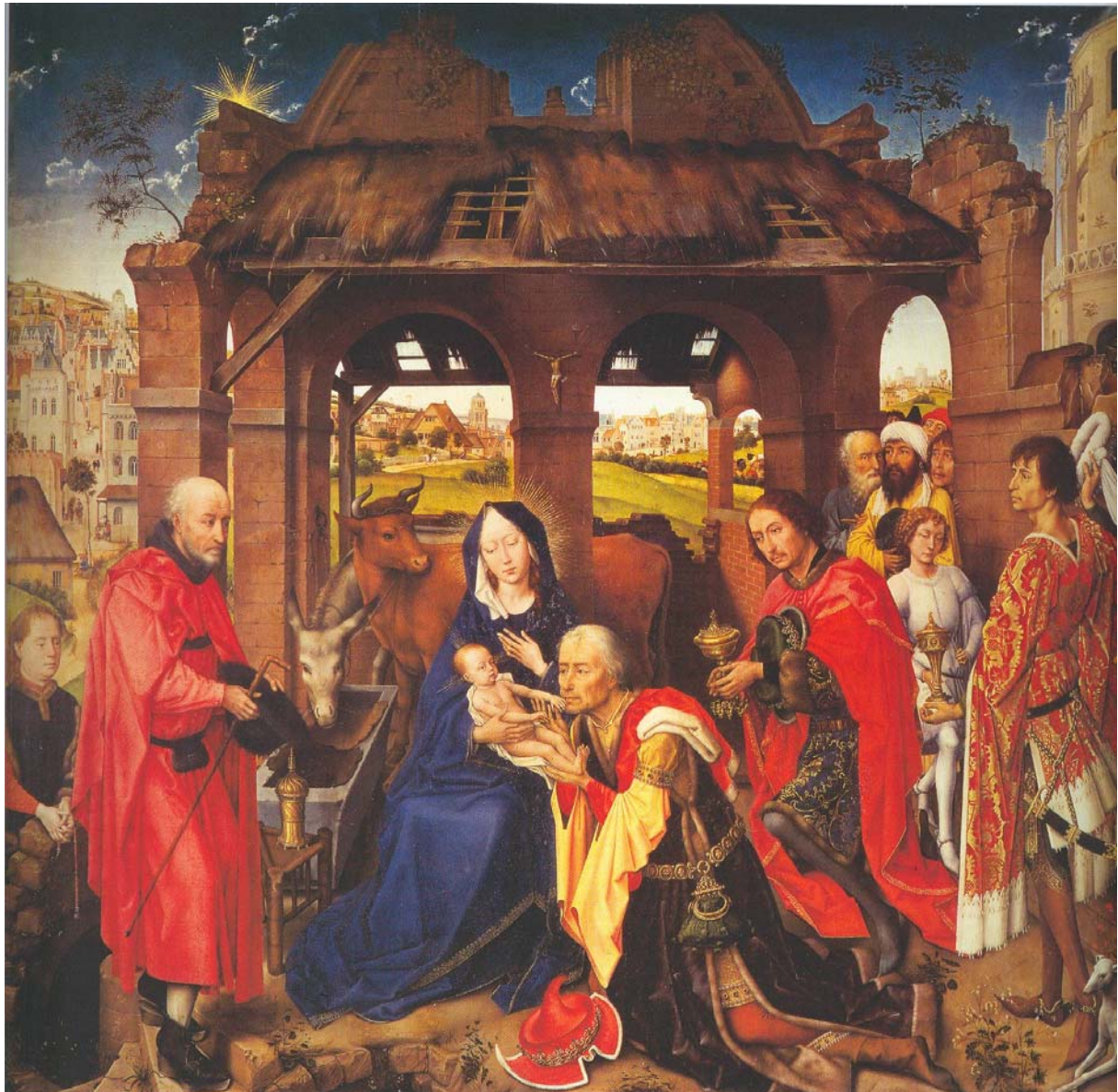
Rogier van der Weyden (1399-1464): Columba-altaar, middelste paneel: De aanbidding van de koningen, ca. 1455. (Alte Pinakothek, München). De drie koningen (wijzen) zijn met een groot gevolg uit het Verre Oosten gekomen en knielen nu, in verschillende bewegingsfasen voor het pasgeboren kind. Ze stellen traditioneel de drie leeftijdsfasen voor: jongeman, een man van middelbare leeftijd en een oude man. Het kruis in het midden van

In oude volksverhalen is de hele natuur betrokken op het kerstgebeuren. Zo bloeien op de kerstavond de vlier en de appelboom; wie eronder staat, ziet de hemel open; het water in de beken, putten en sloten verandert in wijn; de oneraardse klokken luiden; de huisdieren, vooral de koeien op stal (in Vlaanderen de paarden) spreken met elkaar in menselijke taal; de bijen zingen. In Staphorst staan tussen twaalf en één alle kippen op één poot; ook liggen alle koeien er op de rechterzij en is alle hout zouthout en alle water wijn. In West-Vlaanderen liggen de schapen gekniel. Te Mallingen in Limburg roept de haan: 't Kindeke Jezus is geboren!. De duif vraagt: Hoe? Hoe? Het lam antwoordt: Te Bethlehem!