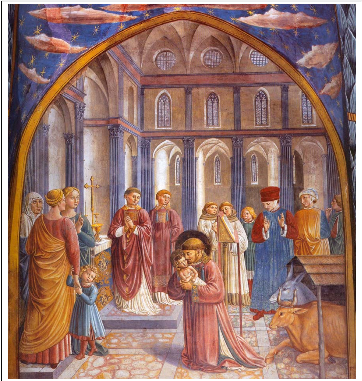
Benozzo Gozzoli (1420-1497): Het kerstfeest in Greccio , fresco in de hoofdkoorkapel San Francesco in Montefalco, 1450-1452, 304x220 cm.