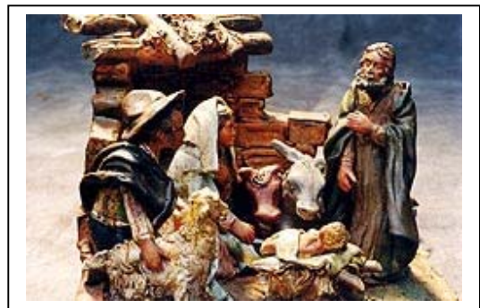
Kerstgroep, vervaardigd door I.M. Scaratella (1953), Caltagirone (Italië), beschilderd terracotta, 18x18x16 cm, uit collectie Houtzager, Bijbels openluchtmuseum

Het geheel is niet door Franciscus bedacht. Al eerder waren er dergelijke kerstspelen . Vanaf de 11 e eeuw werden er in of voor de kerken scènes uit de geboorteverhalen opgevoerd. In de benedictijnenabdij van St Benoit-sur-Loire besloot men om in de kerstnacht de kribbe niet meer in het koor van de kerk op te stellen, maar in het minder gewijde portaal, zodat ook de os en de ezel in het geheel konden figureren. Vanaf 1550 vond de opstelling van kerststallen in de rooms-katholieke kerk plaats. In de tijd van de reformatie verdwenen de kerstspelen. Nu komen ze weer wat terug.