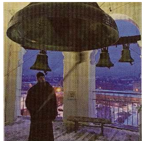
Klokken in het klooster van Danilovsky in Moskou (het spirituele huis van de orthodoxe kerk). (foto AP).

Klokken hebben hier de status van 'zingende iconen' die een spiritueel tussenmedium vormen tussen God en de gelovige.