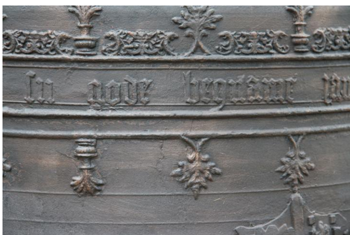
Luidklok van Hervormde Kerk te Wilnis. Detail van de tekstrand op de klok. Zichtbaar hier 'In gode bequame'.

Klokken hebben hier de status van 'zingende iconen' die een spiritueel tussenmedium vormen tussen God en de gelovige.