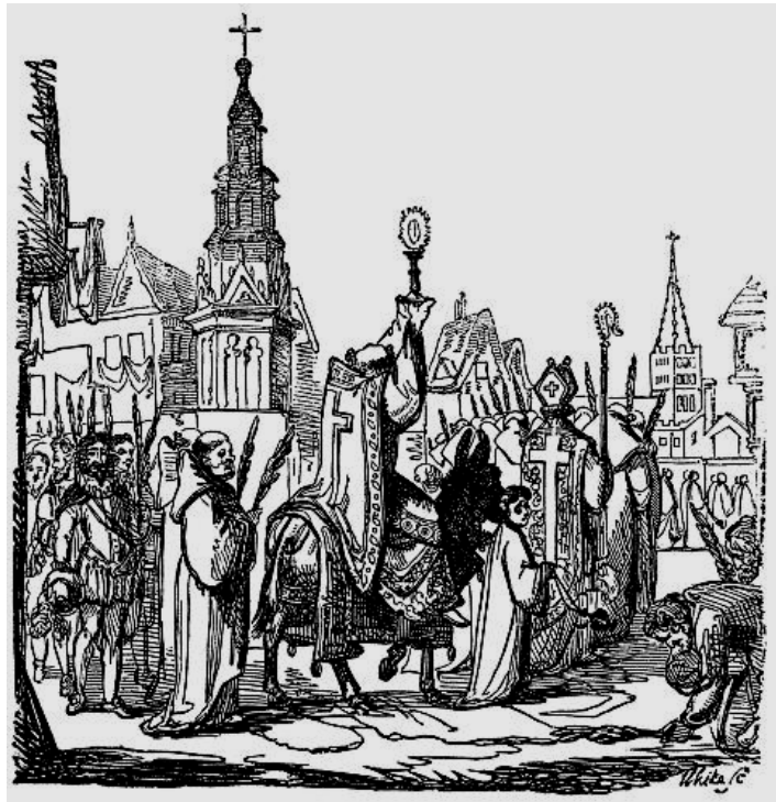
Palmpasenprocessie, illustratie (10,5 x 11 cm) uit: William Hone, The Everyday Book and Table Book , London 1826.

Ik zegen hier mijn koorn, Tegen de bliksem en tegen de oorm, Tegen de meisens en tegen de knechten, Dat ze mijn koorn niet ommevechten; En tegen dat duivelse zwijnges 1 , Dat zo kwaad om pikken es.