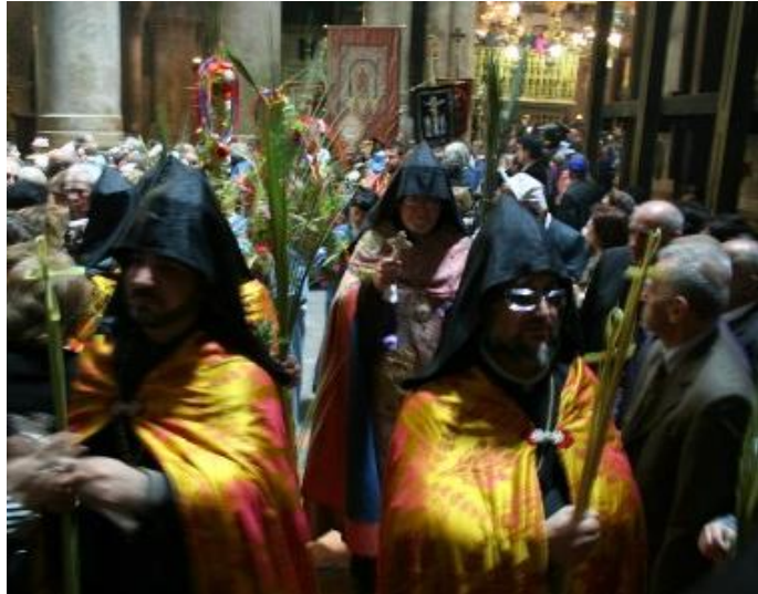
Intocht in Jeruzalem op Palmzondag

De palmpasestok is met veel symboliek omgeven. De groene takjes verwijzen naar Jezus' intocht in Jeruzalem, het brood naar de instelling van het avondmaal (de eucharistie) op