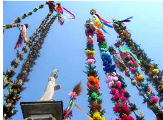
Palmpasen in Polen

In de Byzantijnse ritus raakte de palmpasenprocessie in onbruik. Alleen de melkieten bleven trouw aan de oude traditie. De palmwijding verdween niet. Zo bewierookt nog ieder jaar op palmzondag de Grieks-orthodoxe priester in kruisvorm palmtakken en geeft die aan de gelovigen. Bij ontvangst van een tak kussen de gelovigen eerst het