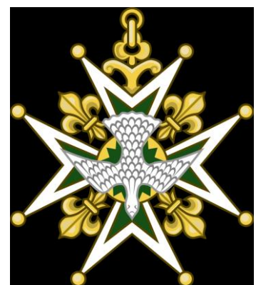
Kruis van de Orde van de Heilige Geest.