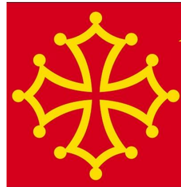
Occitaans kruis (regio Languedoc-Roussillon).

In de loop van de tijd ontstond er een sieraad en herkenningsteken van Franse protestanten waarvan de vorm in feite niet afweek van die van het Maltezerkruis dat hoorde bij de Orde van de Heilige Geest. Het verschil bestond erin dat op het kruis niet het symbool